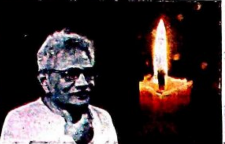
সিপিএম এর সর্বভারতীয় সাধারণ সম্পাদক তথা রাজ্যসভার প্রাক্তন সাংসদ সীতারাম ইয়েচুরি (৭২ বছর) মারা গেলেন।

গত সপ্তাহের পর ১২ সেপ্টেম্বর: 'এসবিআই আশা স্কলারশিপ প্রোগ্রাম' এর তৃতীয় সংস্করণ চালু করল 'এসবিআই ফাউন্ডেশন'। এই উচ্চাভিলাষী কর্মসূচির লক্ষ্য হল, ভারত জুড়ে সুবিধাবঞ্চিত ১০,০০০ মেধাবী শিক্ষার্থীকে তাদের শিক্ষণত স্বপ্ন পূরণ করতে আর্থিক সহায়তা প্রদান করা। এই কর্মসূচির অধীনে, যষ্ঠ শ্রেণি থেকে স্নাতকোত্তর স্তরের শিক্ষার্থীরা এক বছরে ১৫ হাজার টাকা থেকে ২০ লাখ টাকা পর্যন্ত বৃত্তি পেতে পারেন। শোভাময় মাছ চাষের জন্য, ভুবনেশ্বরে 'রসিন মছলি' নামে একটি নতুন মোবাইল অ্যাপ চালু করলেন কেন্দ্রীয় মন্ত্রী রাজীব রঞ্জন সিং। শোভাময় মাছের যত্ন, প্রজনন, আকোয়ারিয়াম ব্যবস্থাপনা, কর্মসংস্থান ও স্থানীয় ব্যবসার প্রচারের জন্য এই অ্যাপটি চালু করা হয়েছে। এই সংক্রান্ত বিষয়ে ব্যাপক তথ্য প্রদান করতে সক্ষম হবে এই অ্যাপটি। 'প্রধানমন্ত্রী মৎস্য সম্পদ যোজনার' (দেশে মাছ চাষ ও জলজ চাষ বৃদ্ধিতে সাহায্যকারী একটি প্রকল্প) অধীনে, আইসিএআর-সেন্ট্রাল ইনস্টিটিউট অফ ফ্রেশওয়াটার অ্যাকোয়াকালচার এই অ্যাপটি তৈরি করেছে। শোভাময় মাছের প্রতি আগ্রহী ব্যক্তিদের চাহিদা মেটাতে এই অ্যাপটি তৈরি করা হয়েছে। মূলত শৌখিন ব্যক্তি, অ্যাকোয়ারিয়ামের দোকানের মালিক ও মাছ চাষিরা এই অ্যাপটির মাধ্যমে উপকৃত হবেন। ৮টি ভারতীয় ভাষায় উপলব্ধ এই অ্যাপটি গুগল প্লে স্টোর থেকে ডাউনলোড করা যাবে।