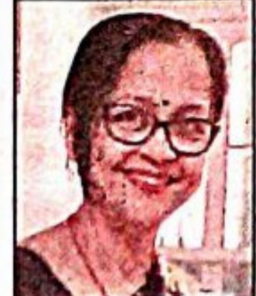
নার্সিংকে পেশা হিসাবে নিলে কোর্স শেষে নিশ্চিত চাকরি। গুরুত্বপূর্ণ এই কোর্সের খুঁটিনাটি ব্যাপারে জানালেন, 'মেয়েদের জন্য রাজ্যের অন্যতম সেরা নার্সিং কলেজ, কল্যাণী'