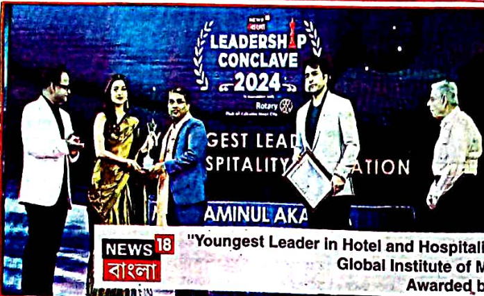
"Youngest Leader in Hotel and Hospitality Education" at the Leadership Conclave 2024 Global Institute of Management Studies (GIMS) Awarded by News 18 Bangla