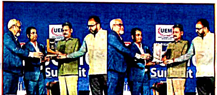
Best Placement in Hospitality Industry Global Institute of Management Studies (GIMS) Awarded by News 18 Bihar Jharkhand