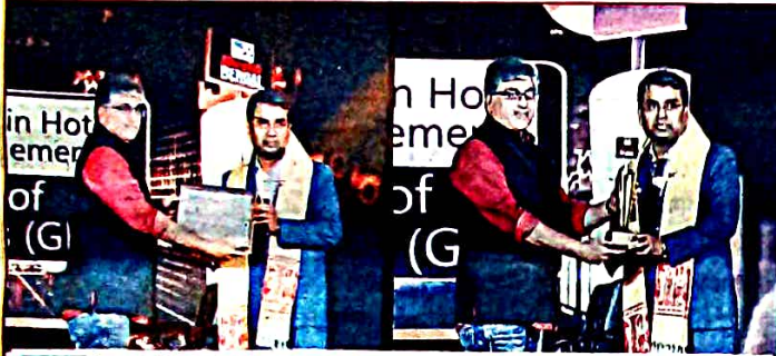
Excellence Placement in Hotel and Hospitality Management Global Institute of Management Studies (GIMS) Awarded by TV9 Bangla

15 ই আগস্ট এর মধ্যে ভর্তি হলে শুধুমাত্র Admission Fee বাড়ি থেকে দিতে হবে, বাকি টাকা Income করে পরিশোধ করার সুযোগ